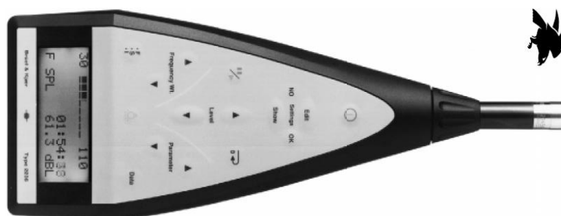
Ηχόμετρο ακριβείας τύπου I της Bruel & Kjaer, μοντέλο 2236.

Για τον έλεγχο του παραγόμενου κατασκευαστικού θορύβου χρησιμοποιείται το Ολοκληρωτικό Ηχόμετρο ακριβείας τύπου I σύμφωνα με IEC (1979) και 804 (1985) Type 1, ANSI S1.4-1983 & Draft S 1.43, 6.9.92, Type 1S, και BS 5969: 1981 Type 1. Bruel & Kjaer Precision Integrating Sound Level Meter Type 2236. Μετρήσεις: MaxL, MinL, Peak, SPL, L eq, L N ( π . χ . L1, L10, L90), SEL, IEL, L EPd. Βαθμονομητής Ηχομέτρου. Lutron SC -640