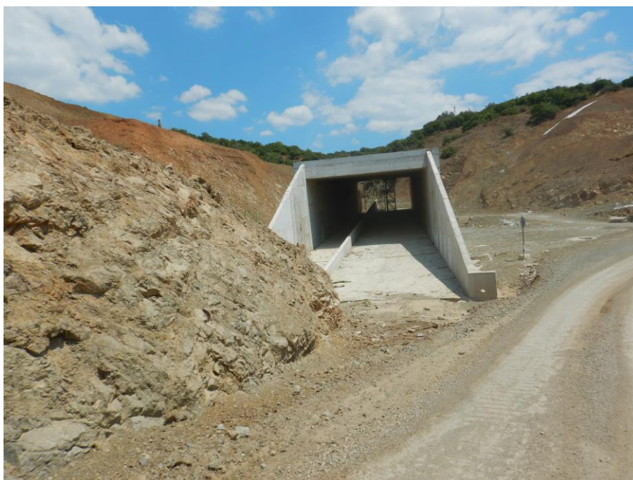
Κατασκευή Κάτω Διάβασης Πανίδας – Οχετού διαστάσεων 10μΧ6μ στη Χ.Θ. 22+482 περίπου.