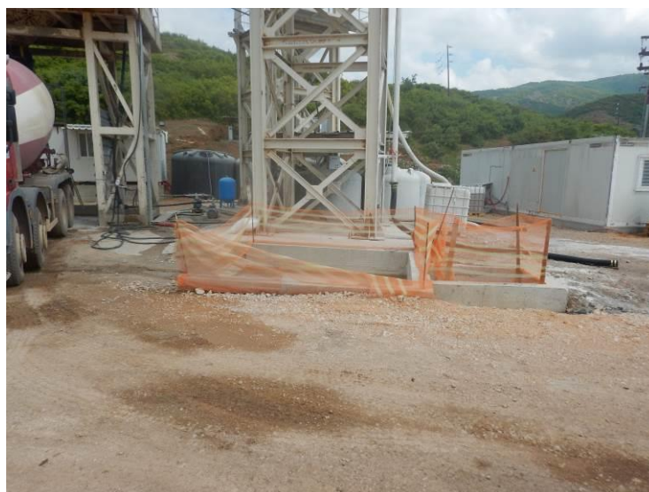
Δίχωρη δεξαμενή καθίζησης αποβλήτων παρασκευαστηρίου σκυροδέματος στο εργοτάξιο «Σαμόλακας»