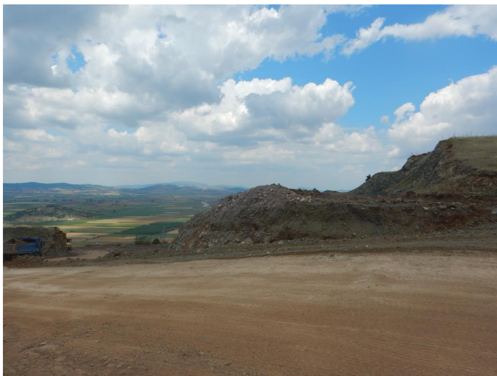
Εργασίες αποκατάστασης παλαιού λατομικού χώρου στη θέση «Παλαιό Μεταλλείο».