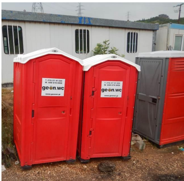
Χημικές τουαλέτες στην έξοδο της σήραγγας T2.

Τέλος, περιορίζεται στο μέγιστο η χρήση ουσιών που περιέχουν επικίνδυνες ουσίες ή άλλες ουσίες που μπορούν να μεταβάλλουν τα ποιοτικά χαρακτηριστικά των υδάτινων πόρων.