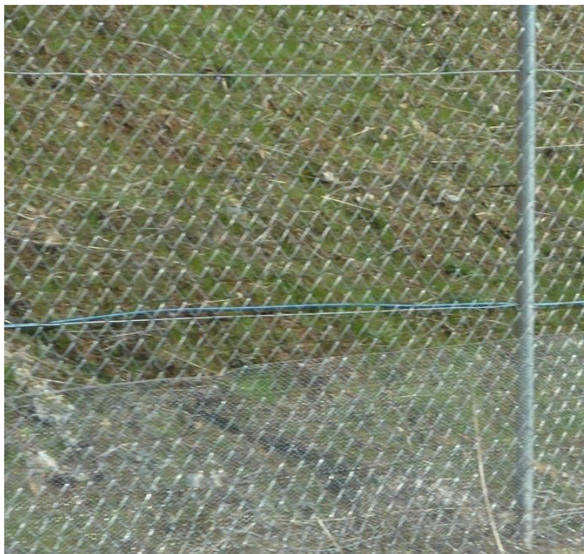
Διπλή περίφραξη διαφορετικής οπής πλέγματος για την αποτροπή εισόδου μικρόσωμων θηλαστικών εντός του αυτ/μου.