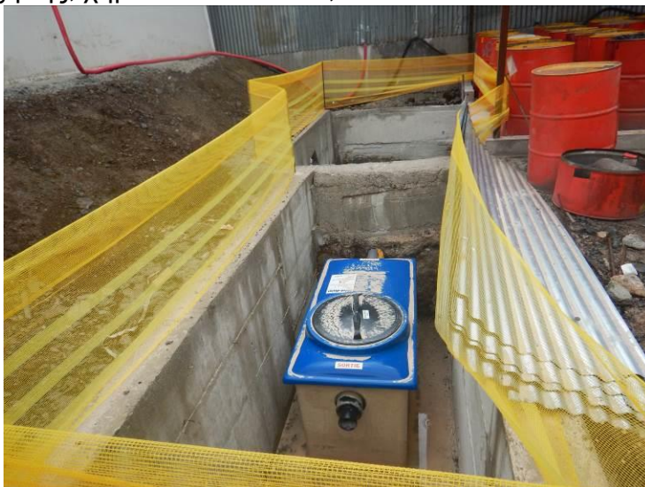
Ελαιοδιαχωριστήρας στο συνεργείο του εργοταξίου «Σαμόλακας»

Επίσης, στο πλαίσιο προστασίας των υδάτινων πόρων κατά τη διάρκεια κατασκευής του έργου, λαμβάνονται μια σειρά από μέτρα, όπως λειτουργία ελαιοδιαχωριστήρων, δεξαμενών καθίζησης, χημικών τουαλετών, κλπ.