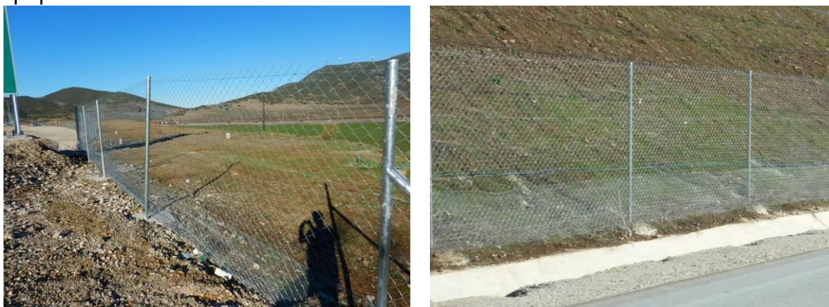
Ενισχυμένη, υψηλή περίφραξη.

Ειδικών προδιαγραφών (κατάλληλου ύψους, ενίσχυσης και οπής πλέγματος), προβλέπεται όπου απαιτείται.