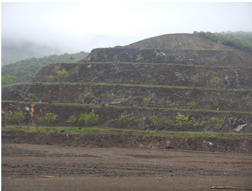
Επιτυχής δενδροφύτευση / αποκατάσταση πρανών λατομικού χώρου «Κιόσκια».