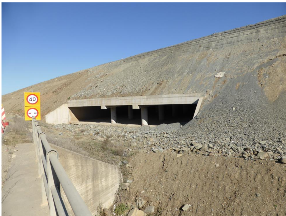
Κατασκευή Κάτω Διάβασης Πανίδας, διαστάσεων 25,5Χ4,5μ., στη Χ.Θ. 46+937, κατ' επιταγή του προγράμματος παρακολούθησης πανίδας. Απομένουν οι εργασίες τελικής διαμόρφωσης των στομίων.