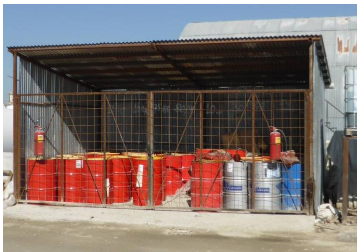
Χώρος προσωρινής αποθήκευσης χρησιμοποιημένων ορυκτελαίων εντός του εργοταξίου Αγ. Θεοδώρων.