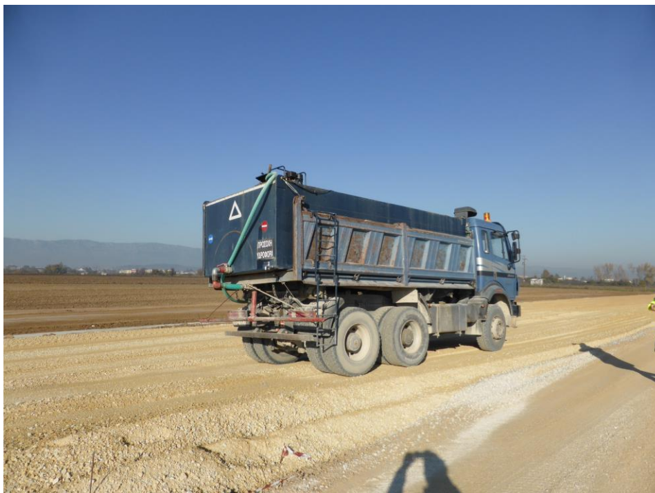
Υδροφόρα διαβροχής χωμάτινων επιφανειών.

Σύμφωνα με τις εγκεκριμένες περιβαλλοντικές μελέτες του οδικού έργου και των συνοδών του, δεν αναμένονται υπερβάσεις του ορίου εκπομπής σκόνης σε απόσταση μεγαλύτερη των 20m από τις εργασίες, σε όλο το μήκος του υπό κατασκευή αυτοκινητοδρόμου και τους εργοταξιακούς χώρους. Πάραυτα λαμβάνονται όλα τα απαραίτητα μέτρα περιορισμού σκόνης, όπως συστηματική διαβροχή, εξοπλισμός οχημάτων μεταφοράς, χρήση σακκόφιλτρων, κλπ.