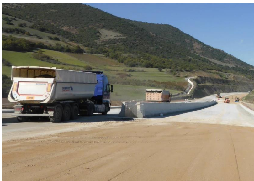
Μεταφορά χαλαρών γαιώδων υλικών με φορτηγά εφοδιασμένα με τον απαραίτητο εξοπλισμό για τη μείωση της σκόνης («κουρτίνες», λασπωτήρες, εξατμίσεις στραμμένες μακριά από το έδαφος.

Μέχρι σήμερα δεν έχουν αναφερθεί παράπονα – οχλήσεις από την παραγόμενη αέρια ρύπανση κατά τη διάρκεια κατασκευής του έργου.