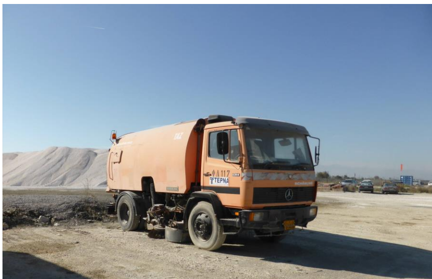
Όχημα καθαρισμού. Χρησιμοποιείται για τον καθαρισμό των ασφαλτοστρωμένων οδών προσπέλασης.