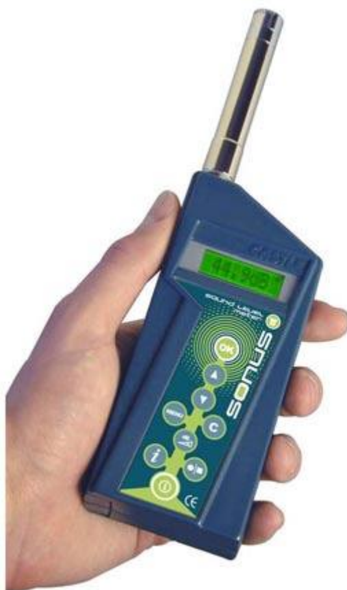
Ηχώμετρο ακριβείας τύπου 2 της CASTLE, μοντέλο GA 216 I, σύμφωνα με τις προδιαγραφές IEC61672-1-2002.

Στόχος των ηχομετρήσεων ήταν η καταγραφή του παραγόμενου θορύβου από τις κατασκευαστικές εργασίες σε σχέση με πιθανές θέσεις όχλησης, ώστε σε περίπτωση διαπίστωσης υπέρβασης των ορίων θορύβου, να ληφθούν τα κατάλληλα μέτρα ηχοπροστασίας. Για το σκοπό αυτό σε κάθε μέτρηση καταγράφηκε ο δείκτης θορύβου L_{eq} : Ισοδύναμη συνεχής ηχοστάθμη (κατά IEC 651) σε dB(A).