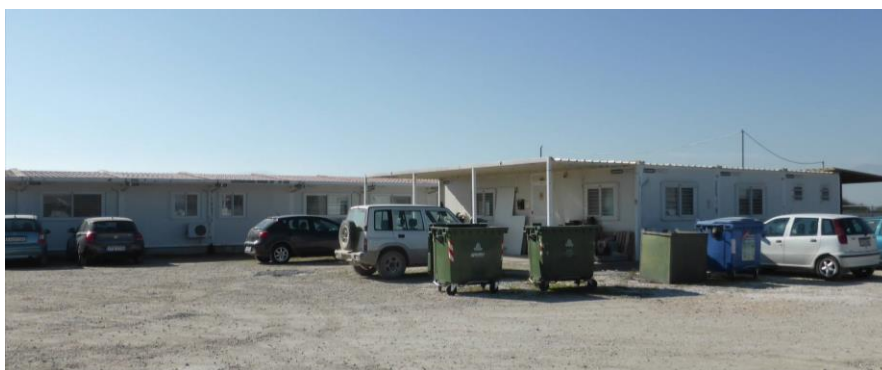
Κάδοι συλλογής αστικών απορριμμάτων και κάδος ανακυκλώσιμων υλικών εντός του εργοταξίου Αγ. Θεοδώρων, σε συνεργασία με το Δ. Σοφάδων.

Στον παρακάτω πίνακα (πίνακας 4.3.1-1) παρουσιάζεται ο τρόπος διαχείρισης καθώς επίσης και οι ποσότητες των αποβλήτων οι οποίες διαχειρίστηκαν οικολογικά εντός του έτους 2015 στο πλαίσιο κατασκευής του έργου.