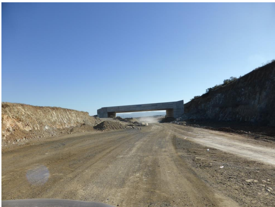
Υπό κατασκευή Άνω Διάβασης Πανίδας (Πράσινη Γέφυρα), πλάτους 30μ, στη Χ.Θ. 43+856, κατ' επιταγή του προγράμματος παρακολούθησης πανίδας.